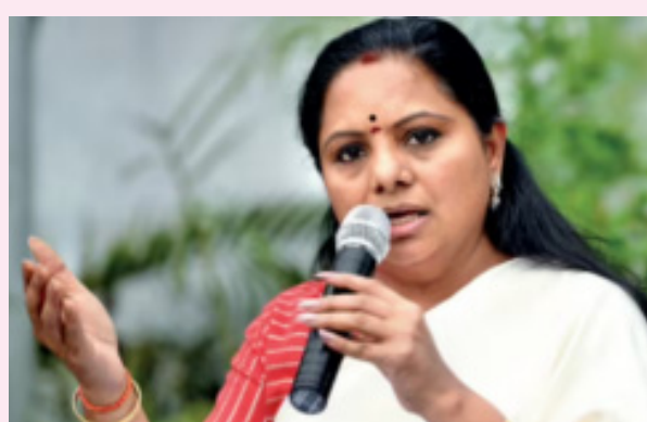
పైర్ అయ్యారు. సొంత రాష్ట్రం వస్తే నీళ్లు వస్తాయని, వలసలు ఆగిపోతాయని, తమ బతుకులు బాగుపడతాయని అనుకున్న

పాలమూరు ప్రజలు గుంట నక్క హారీష్ రావు చేతుల్లో బలైపోయారంటూ కల్యాణకుంట్ల కవిత మండిపడ్డారు. హారీష్ రావు ధనదాహానికి పాలమూరు, రంగారెడ్డి, నల్లగొండ జిల్లాల ప్రజలు బలైపోయారంటూ కల్యాణకుంట్ల కవిత అనడంతో ఇప్పుడు కాంగ్రెస్ చేస్తున్న ఆరోపణలకు ఊతమిచ్చినట్లుంది. అయితే కల్యాణకుంట్ల కవిత కు కౌంటర్ ఇచ్చే వారు ఇప్పుడు బీఆర్ఎస్ లో కనిపించడం లేదు. అలాగే హారీష్ రావు కూడా తనపై కవిత చేస్తున్న ఆరోపణలకు కూడా సమాధానం ఇవ్వలేదు. కల్యాణకుంట్ల కవిత ను కంట్రోల్ కేసీఆర్ పెట్టకుంటే పార్టీ మరింత ద్యామేట్ అవుతుందని గులాబీ పార్టీ నేతలే వ్యాఖ్యానిస్తున్నారు. మొత్తం కల్యాణకుంట్ల కవిత కారు స్పీడ్ కు బ్రేకులు వేస్తున్నారన్నది సుస్పష్టంగా తెలుస్తోంది.