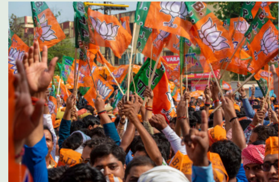
శ్రీకాకుళం, భారత శక్తి ప్రతినిధి, జనవరి 05: శ్రీకాకుళం జిల్లా రాజకీయాలు ఎవరికి అంతు వట్టవు.