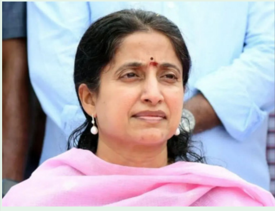
విజయవాడ, భారత శక్తి ప్రతినిధి, జనవరి 05: