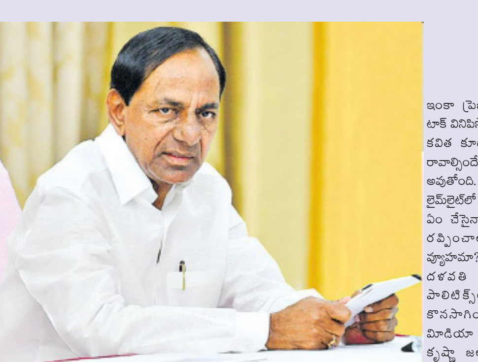
హైదరాబాద్, భారత శక్తి ప్రతినిధి, జనవరి 05:

రేట్లు అదే స్థాయిలో పెరుగుతూ పోయాయి. కిందటి రోజు అంతర్జాతీయ మార్కెట్లో స్పాట్ గోల్డ్ రేటు ఔస్సుకు 4330 డాలర్ స్థాయిలో ఉండగా.. ఇప్పుడు అది మళ్లీ 4410 డాలర్ మార్కు దాటి దూసుకెళ్లింది. అంటే 6 గంటల్లోనే ఏకంగా 80 డాలర్లకు పైగా పెరిగింది. స్పాట్ సిల్వర్ రేటు కూడా.. ఔస్సుకు 72 డాలర్ల స్థాయి నుంచి.. 76 డాలర్ల మార్కును తాకింది. ఇంటర్నేషనల్ మార్కెట్లో ధరల పెంపు ప్రభావం దేశీయంగా.. ఉదయం 10 గంటల తర్వాత కనిపిస్తుంది. ప్రస్తుతం మాత్రం దేశీయంగా బంగారం, వెండి రేట్లు స్థిరంగానే ఉన్నాయి. హైదరాబాద్ నగరంలో 22 క్యారెట్స్ గోల్డ్ రేటు తులం రూ.. 1,24,500 వద్ద ఉంది. జనవరి 3న ధర తగ్గగా.. దానికి ముందు 1,2 తేడిల్లో పెరిగింది. ఇక 24 క్యారెట్స్ పసిడి ధర 10 గ్రాములకు ప్రస్తుతం హైదరాబాద్ మార్కెట్లో రూ. 1,35,820 వద్ద ఉంది. ఇక వెండి ధర ప్రస్తుతం కిలోకు రూ. 2.57 లక్షల వద్ద ఉంది. దీనికి ముందు జనవరి 3న రూ. 3 వేలు తగ్గగా.. జనవరి 2న రూ. 4 వేలు పెరిగింది.